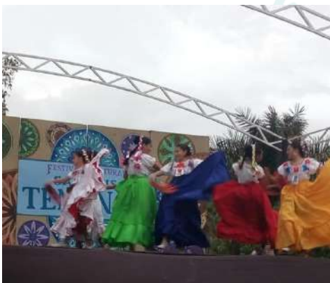
Festival San Luis Tenango