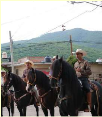
Día de El Charro

En septiembre "Mes de la Patria" realizamos los eventos cívicos correspondientes