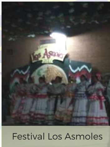
Festival Los Asmoles