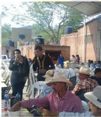
Festival San Isidro