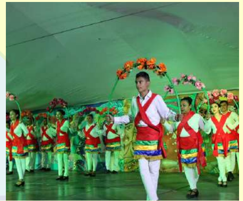
Festival de Aniversario de la Coronación Pontificia de la Virgen de Tonaya 2018