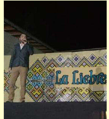
Festival La Liebre