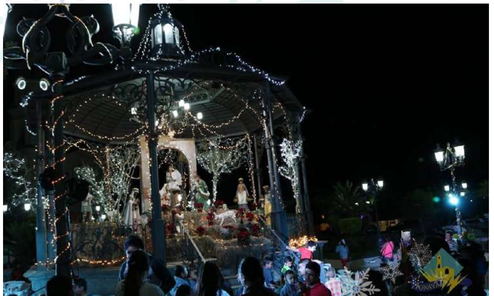
Festival Navideño y tradicional Rosca de Reyes en cabecera y localidades de Tonaya