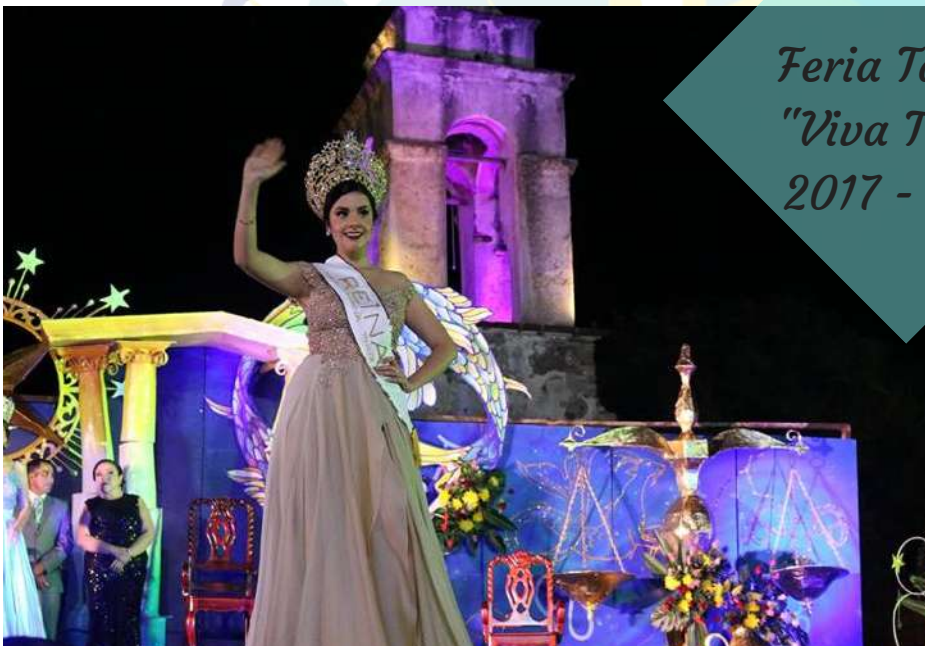
Feria Taurina "Viva Tonaya 2017 - 2018"

Durante todo el año, promovimos el Festival Cultural de cada una de las localidades de nuestro municipio, además de las festividades alusivas al mes de la Patria como: la Celebración del Día del Charro, noche mexicana, y eventos cívicos. El Festival alusivo al día de muertos "La Catrina Tonaya 2017", festejos cívicos y culturales alusivos a la Revolución Mexicana así como los tradicionales festejos de navidad.