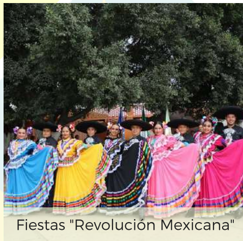
Fiestas "Revolución Mexicana"