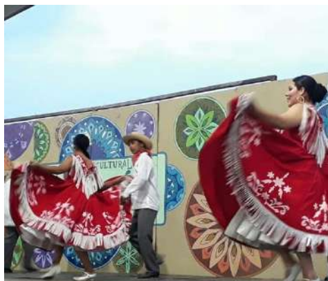
Festival de Los González