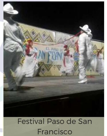
Festival Paso de San Francisco