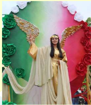
Organización del Desfile de Fiestas Patrias