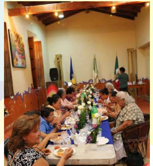
Se otorgó un reconocimiento al Grupo de Coro Municipal "Época de Oro" por sus XIII años de Trayectoria Artística