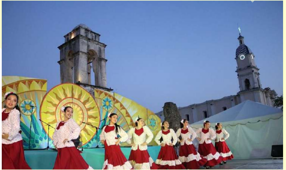
Impulsamos el "5° Festival Cultural Regional del Agave"