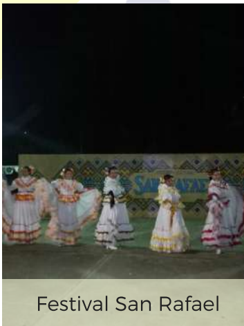
Festival San Rafael