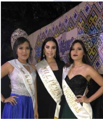
Festival Las Higueras