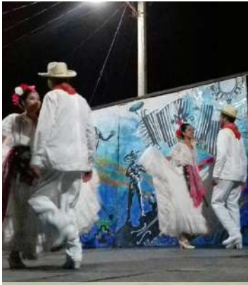
Festival El Cerrito

Llevamos el arte y la cultura en cada una de las localidades de nuestro municipio.