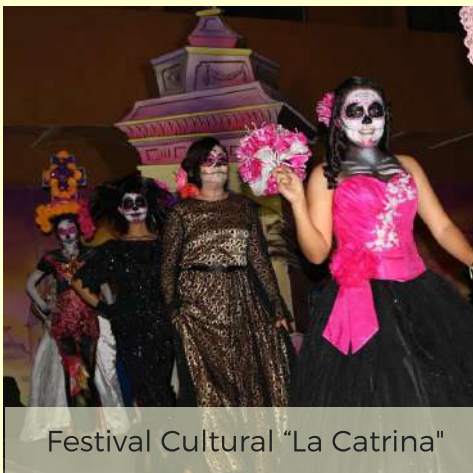
Festival Cultural "La Catrina"