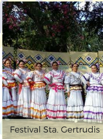
Festival Sta. Gertrudis