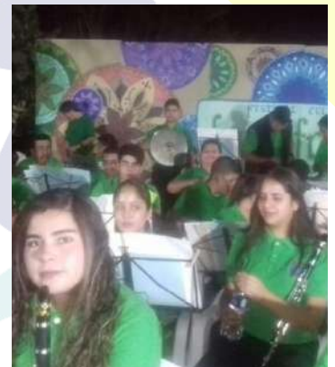
Festival La Cofradía