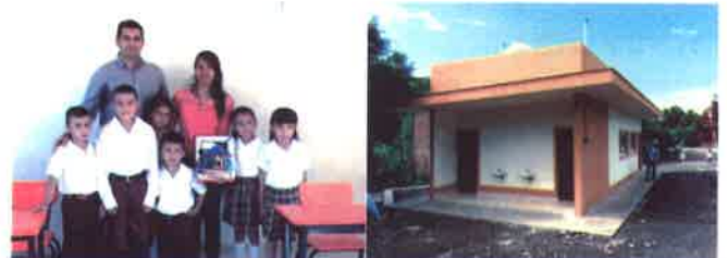
IMAGEN URBANA / TURISMO

∅ Construcción de escuela comunitaria en la comunidad de El Alpizahuatl.